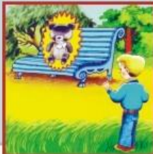
Их могут установить в урнах, под скамейками, в транспорте, на лестничной площадке, в любых общественных местах.