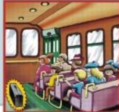
Взрывные устройства террористов могут быть замаскированы под самые обычные предметы: чемодан, сумку, пакет, свёрток, коробку, игрушку и т.п.

Любой бесхозный предмет, обнаруженный в общественном месте, может представлять опасность.