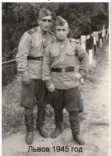
Рис.1. Освобождение Западной Украины.

Сейчас деду 92 года, он жив и здоров, проживает в г. Ростове-на-Дону.