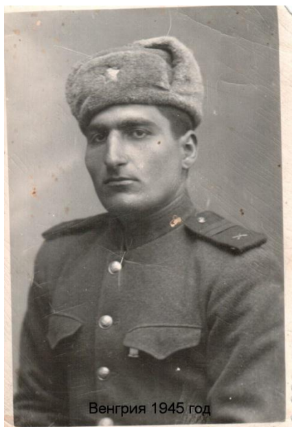
Рис.3. Освобождение Венгрии.