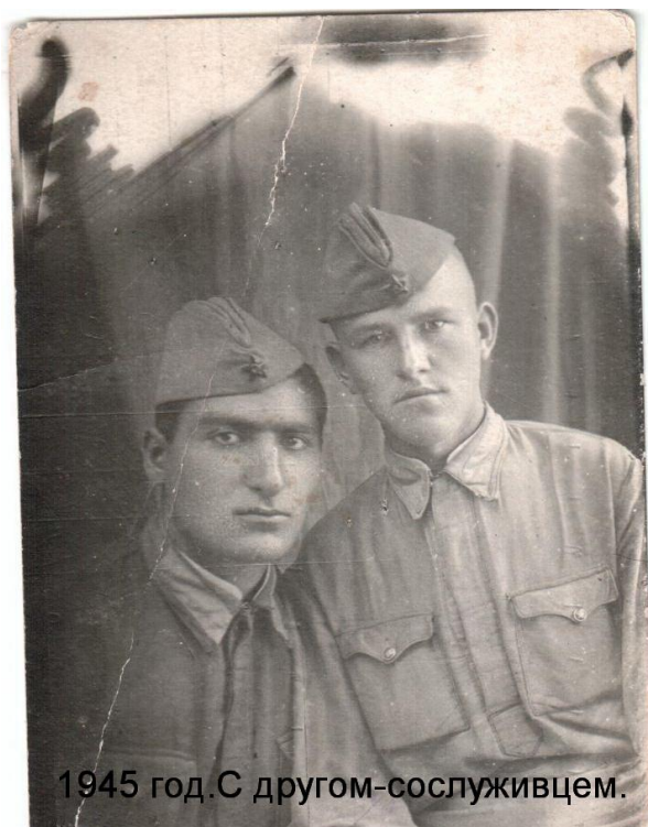
Рис.4. Друзья-однополчане. Май 1945